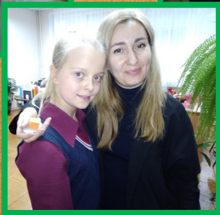
Изготовили и подарили сувениры педагогам и сотрудникам школы.